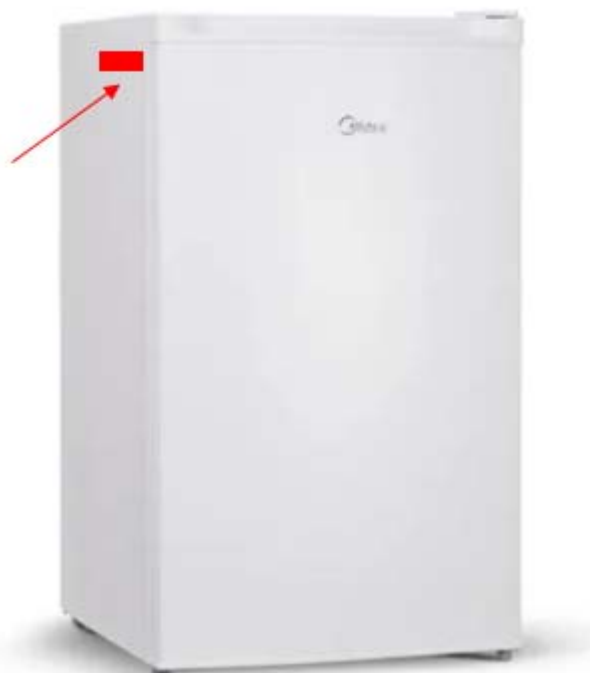
3 - Representação de afixação de etiqueta adesiva em equipamentos e máquinas